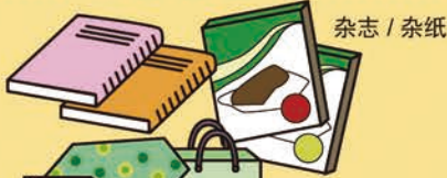
杂志 / 杂纸