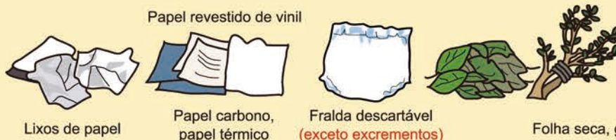
Lixos de papel