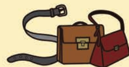
Produto de couro (retirar as peças metálicas)