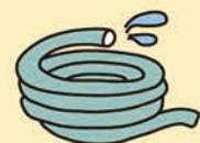
Objetos compridos (cortar em pedaços de 50cm, ou menor)