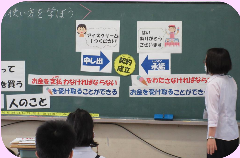
契約が成立するのはいつ？