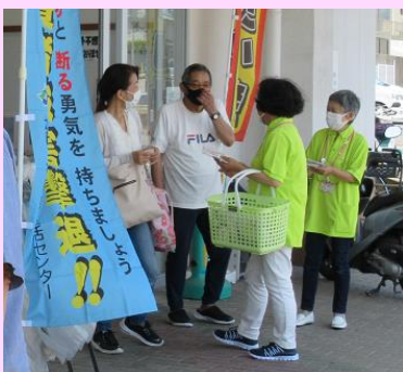
6/23 大阪屋ショップにて