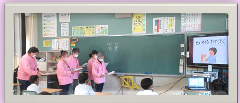
紙芝居「たいせつな おやくそく」