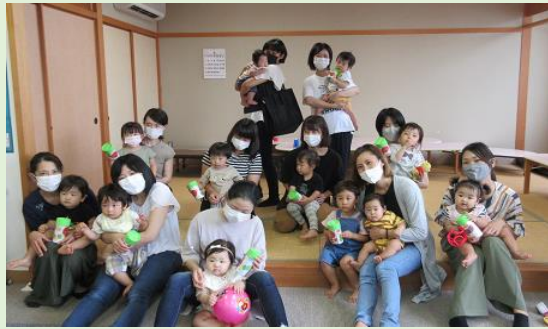
10/1 高松子育て支援センター