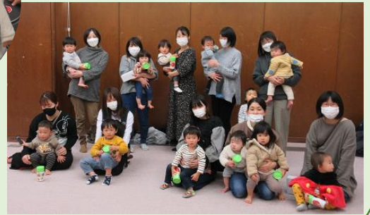
11/25 宇ノ気子育て支援センター