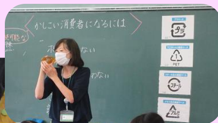
商品についているマークの意味は？