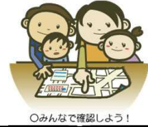
○みんなで確認しよう！