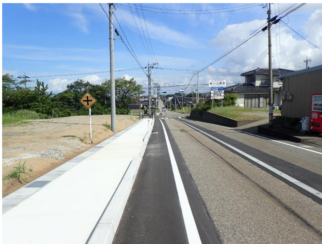
県道高松内灘線(遠塚地内)の歩道整備状況