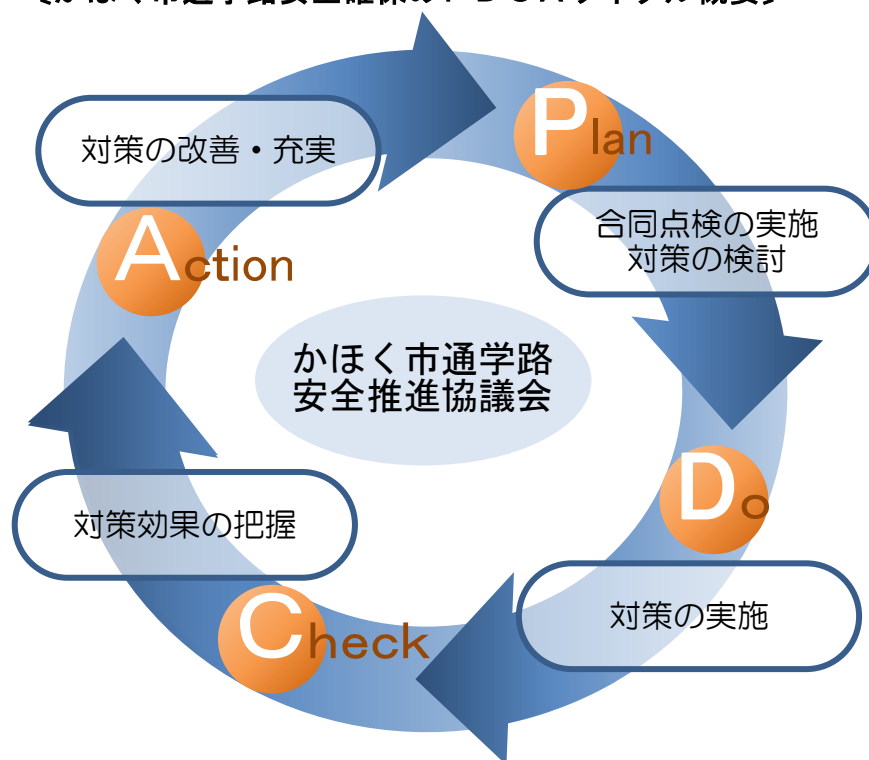
〔かほく市通学路安全確保のPDCAサイクル概要〕

これらの取組みをPDCAサイクルとして実践し、本市通学路の安全性向上を図っていきます。