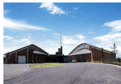
うみっこらんど七塚 (海と渚の博物館)