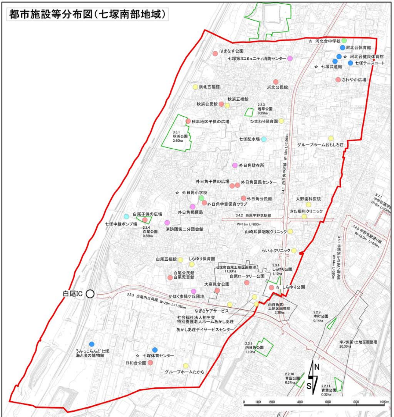
都市施設等分布図(七塚南部地域)