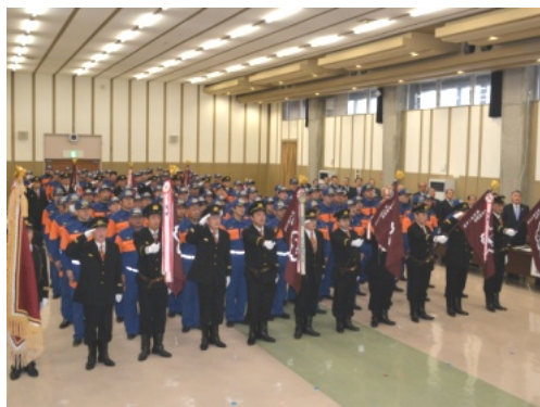
かほく市消防団出初式

地方公務員法の一部が改正されたことにより、成年被後見人等は消防団員となることができないとする規定を削除するなど、所要の改正を行うもの。