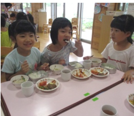
楽しいランチタイム