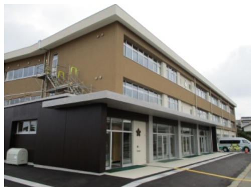
外日角小学校長寿命化改修工事