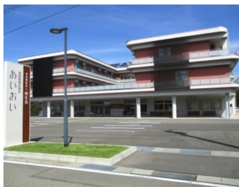
市内の特別養護老人ホーム

A 丸井市民生活部長 個別の回収容器的設置や、その容器的収集のために費用がかかる、現実的には難しい。