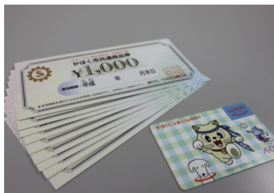
にゃおんWAONカードと商品券