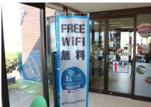
公衆無線LANを設置（道の駅高松）

Q 現在、運転免許証自主返納者に対して、にゃおんWAONカードと商品券を支給しているが、タクシーチケットなどに変えてはどうか。