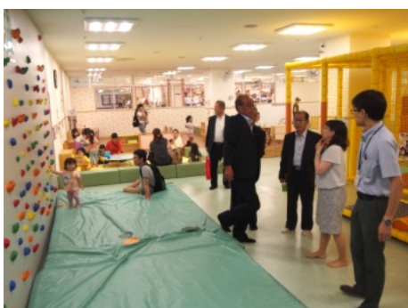
子育て支援施設「ぼこあぼこ」

大型商業施設内にあり、子育て支援センターに、大型複合遊具やクライミングウォールなど各種遊具を備え、託児コーナーも併設していた。市外からの利用者も多く、「子育て支援に力を入れてい