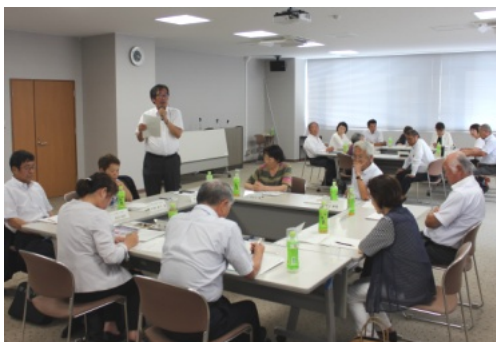
活発な意見交換の様子

タクシー利用料金助成（高齢者、障害者、妊産婦）について、制度内容を改善し、使い勝手を良くできないか。災害時の高齢者の避難につい