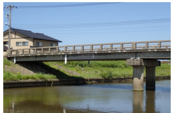
修繕する橋りょう（新化橋）

令和3年度末で500件程度で、今年度末には370件程度になる予定である。今後も国道の拡幅や管の更新など、状況に合わせて順次布設替えを進めていく。