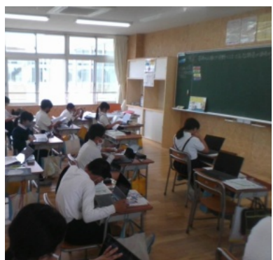
35人学級による授業