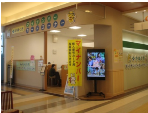
マイナンバーカードコーナー

また、マイナンバーカードコーナーの周知、利用促進を図るためのポスターやマイナンバーカードの利便性をアピールするチラシ、市内の公共施設、医療機関・薬局、金融機関への配布。窓口利用者への直接案内を行う。