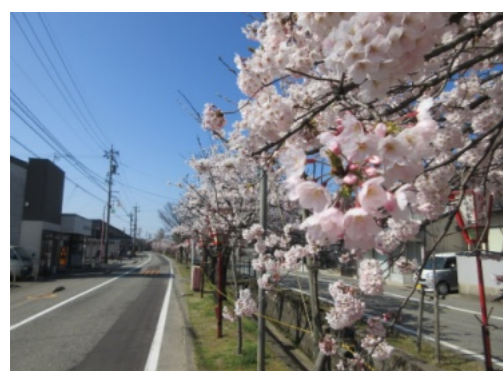
桜並木 (高松中町通り)

A 産業建設部長 百年以上の歴史を誇る高松中町の桜並木はこれまで通り追肥・植え替えなどを行い管理を継続する。