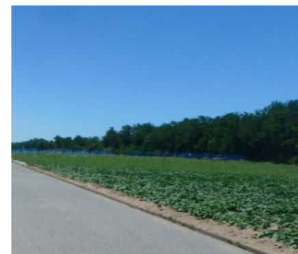
すいか・かほつくり畑 (大崎)

若い世代の転入が増加し、合併当時とは環境が変化している。小規模農業や兼業農家による農業の担い手確保の観点からも、下限面積について市内統一もしくは地域の見直しができないか。