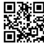
「あそびの森かほく」の利用料金