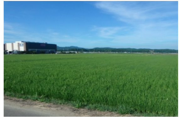
市内（内日角）の水田地帯

令和3年度産コシヒカリと前年度産との仮渡金の差額から、保険などで補填を受ける差額の9割分を差し引いた額の4分の3を助成対象額とした。