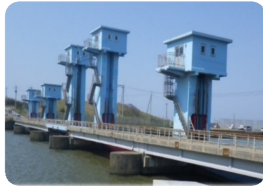
河北潟放水路防潮水門

防潮水門や排水機場などの施設が、完成から50年以上経過し、地盤沈下などによる排水機能の低下や集中豪雨による降雨量の変化により、湛水被害が頻繁に発生していることが課題であり、また、大規模地震などで防潮水門が損壊した場合、洪水時に排水機能を失い、農業用水の確保ができなくなるため、被害は甚大になるとのことであった。