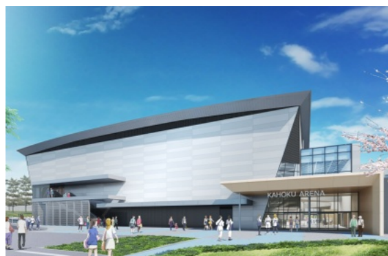
かほく市総合体育館イメージ図

かほく市総合体育館整備においては、客席エリアにゆとりある車いす席を整備し、また、各階に「誰でもトイレ」と称する多目的トイレ、車椅子利用者が使用可能な更衣室、シャワー室を備えるなど、より人に優しい施設となるよう努める。