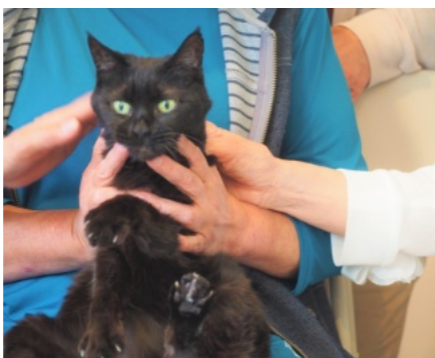
地域猫の取り組み