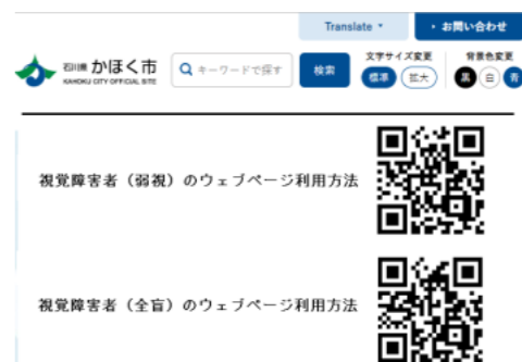
HPと視覚障害者の利用例

* ウェブアクセシビリティ 高齢者や障害者など、身体機能の制約や利用環境などに関係なく、すべての人がウェブで提供される情報を利用できること