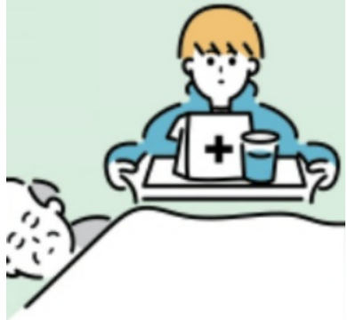
家族を介護する子ども

県もヤングケアラーの実態調査を行う。市の実態と支援策は。 A 健康福祉部長 市も適切な支援をし、ヤングケアラーの子どもたちの権利が守られ、健やかな成長と教育の機会が保障されるよう引き続き関係機関と協議し、支援体制を整備する。