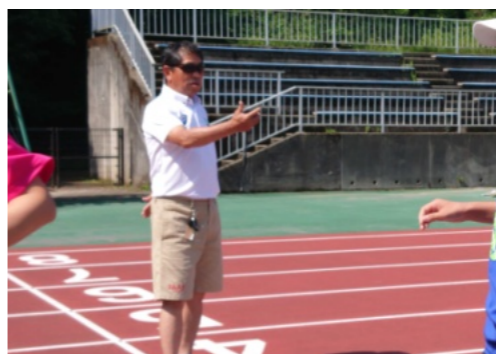
部活動指導員による指導

A 教育長 スポーツ庁は6月6日に有識者会議が提出した提言にもとづき、運動部活動の地域移行を進める方針を示した。今後は、国が示す運動部活動の在り方に関する総合的なガイ