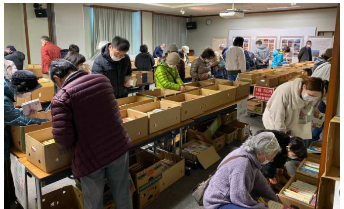
大盛況の古本朝市!