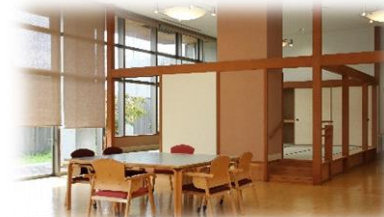
オープンスペース